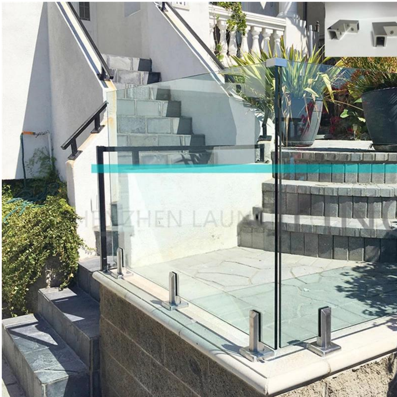
180 asteen lasikiinnikkeelle Mallinumero BC - 80 x 35 myös saatavilla -