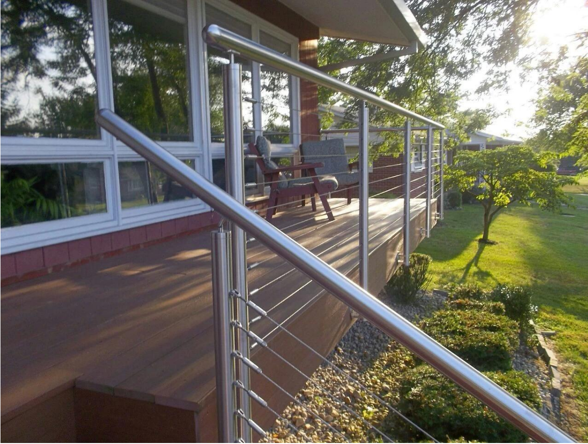
3mm, 4mm, 5mm vaijeri päätyheloja kaapelin pää varusteet kaidetolppien