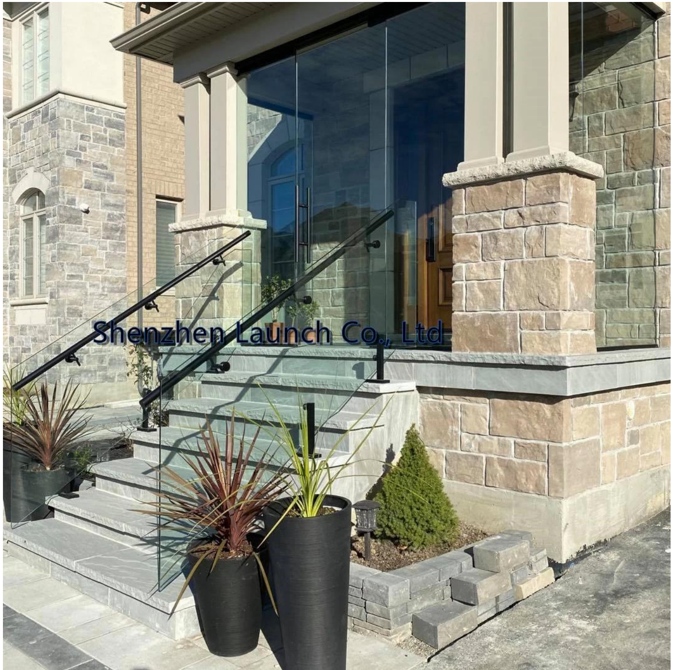
Seinään kiinnitettävä kaiteen kiinnike, P708