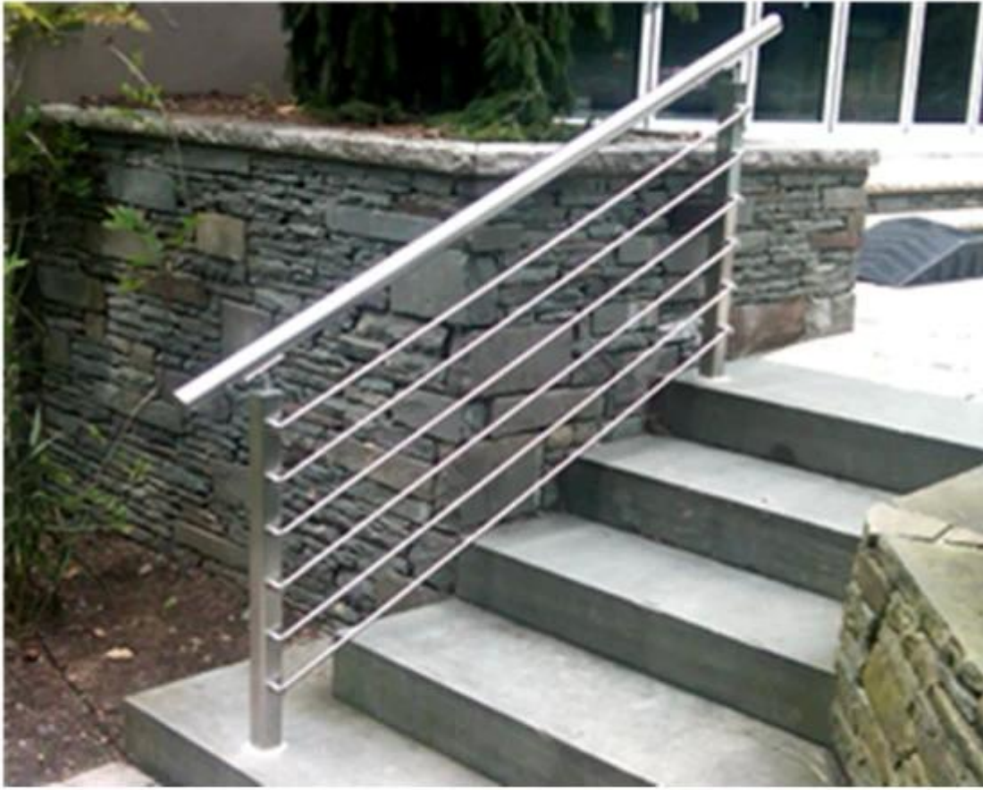
stainless steel handrail with cross bar

meillä on myös muita tyyppjä varten rappu ja parveke ja allas aita 1.glass kaide päätyi puutavaran terasseille ja konkreettisia terasseille Kiina ruostumaton teräs parvekelasit päätyi kehyksettömät lasi kaide, ruostumaton teräs rappu lasi päätyi puutavaran aluslaudoitus