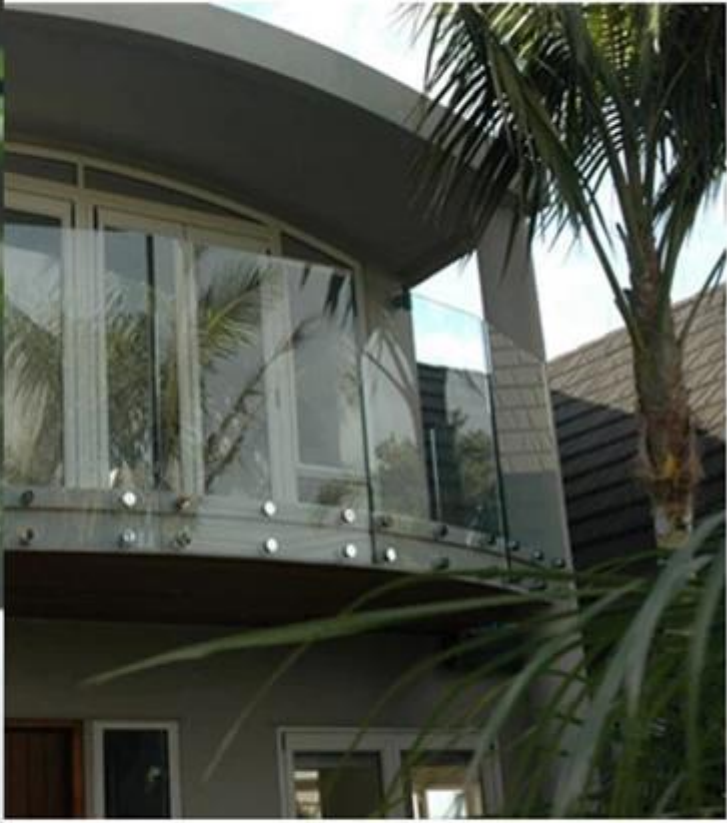
balcony railing design