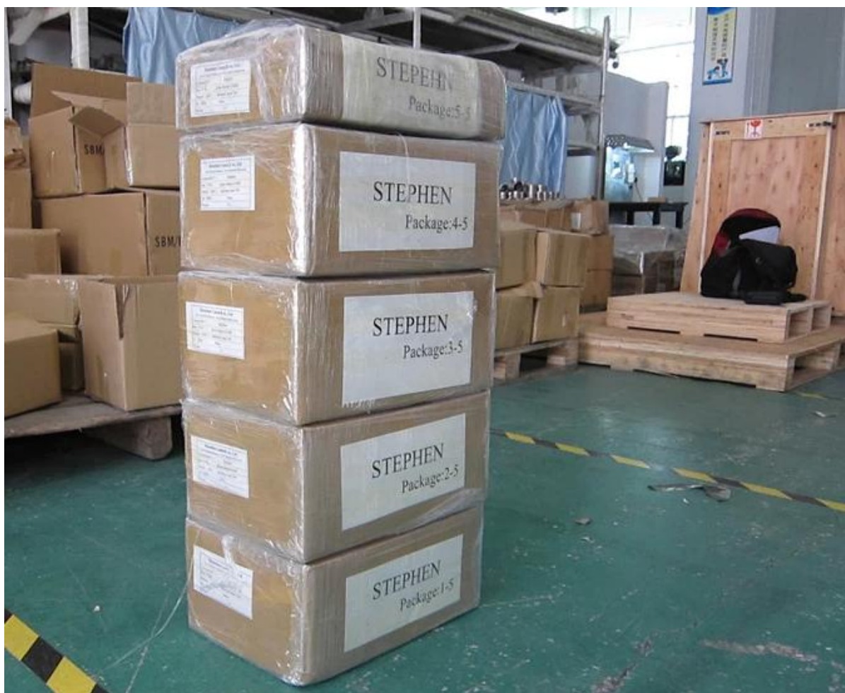
Photos de garde-corps verre inox 316 clips pouces 1/2 verre