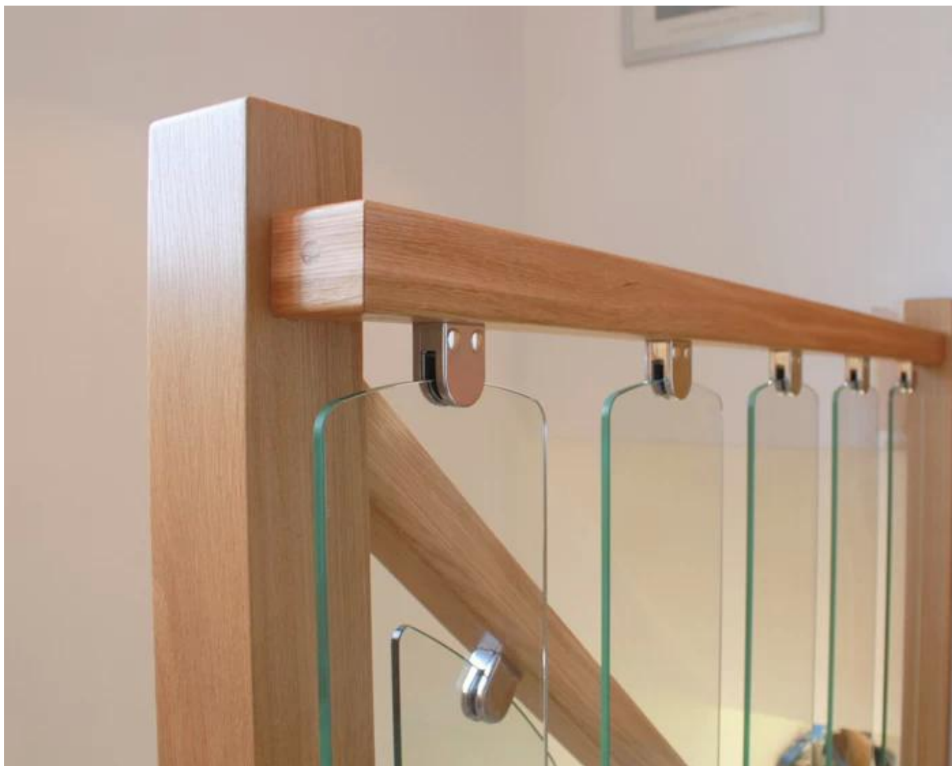
# Autres modèles de pinces à verre-