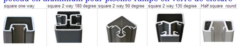
les clôtures de piscine en aluminium poste, semi-rampe en verre sans cadre