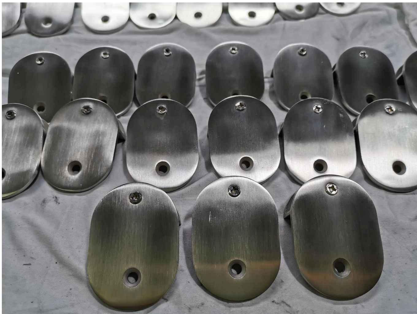
- Photo du projet de verre à 180 degrés sur la pince murale CB-180