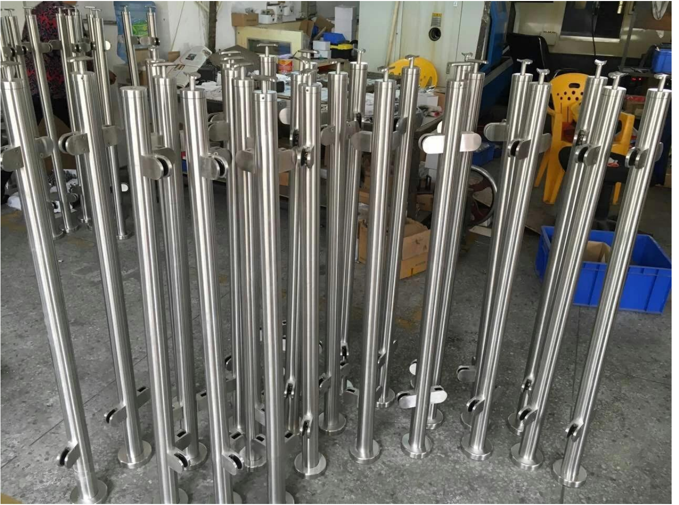
Pinces à verre de main courante: