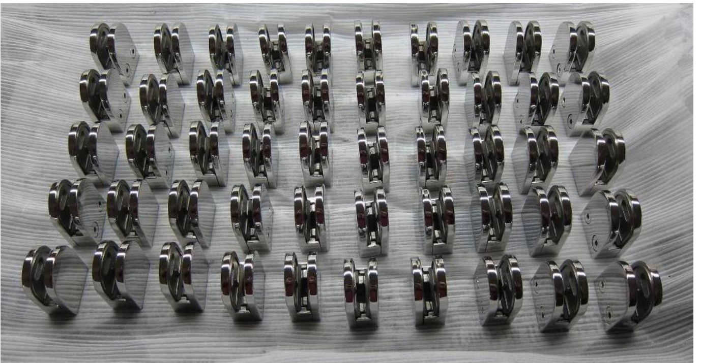
Rond conception poteau de main courante pour sans supports: