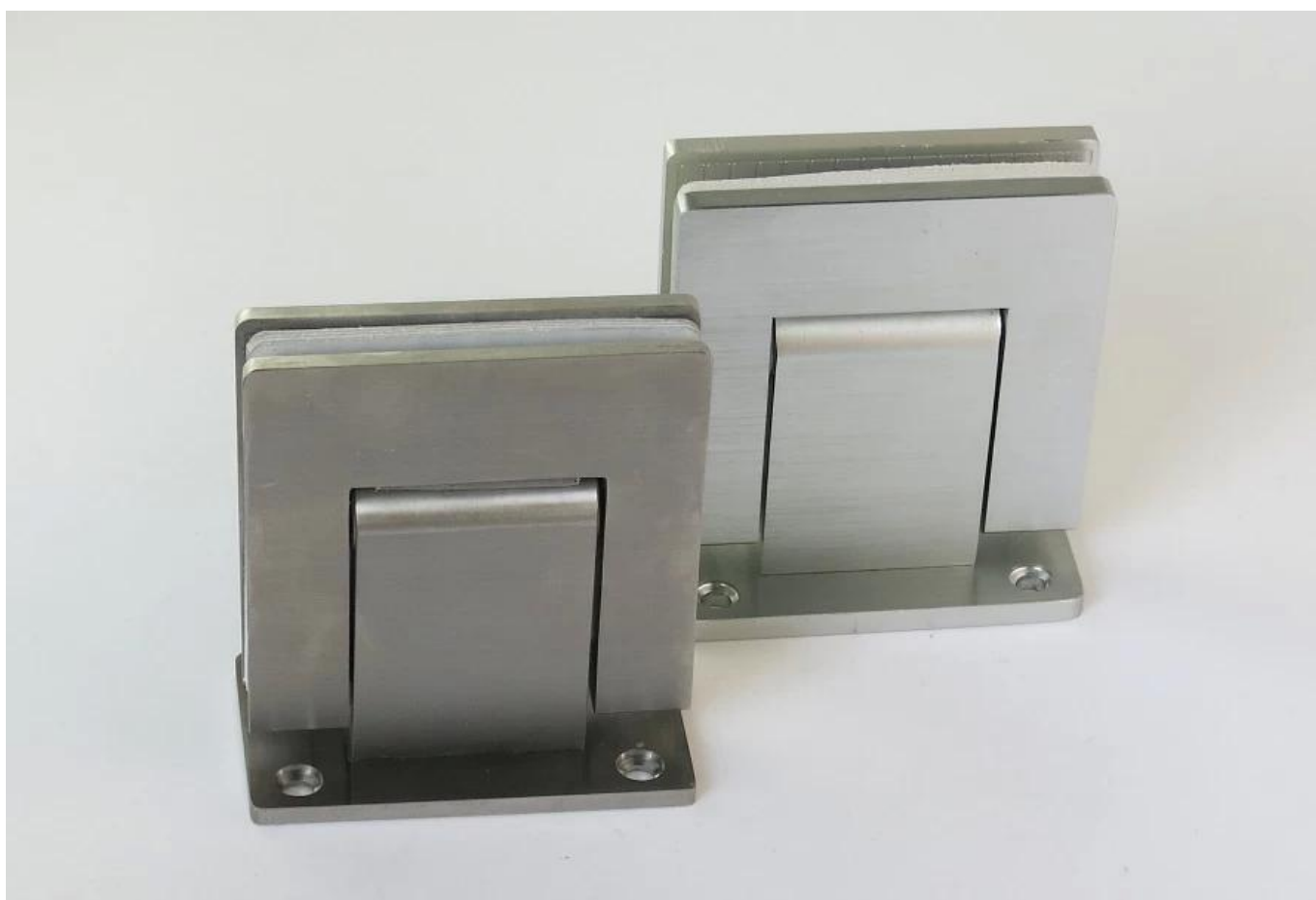
Afficher les détails: