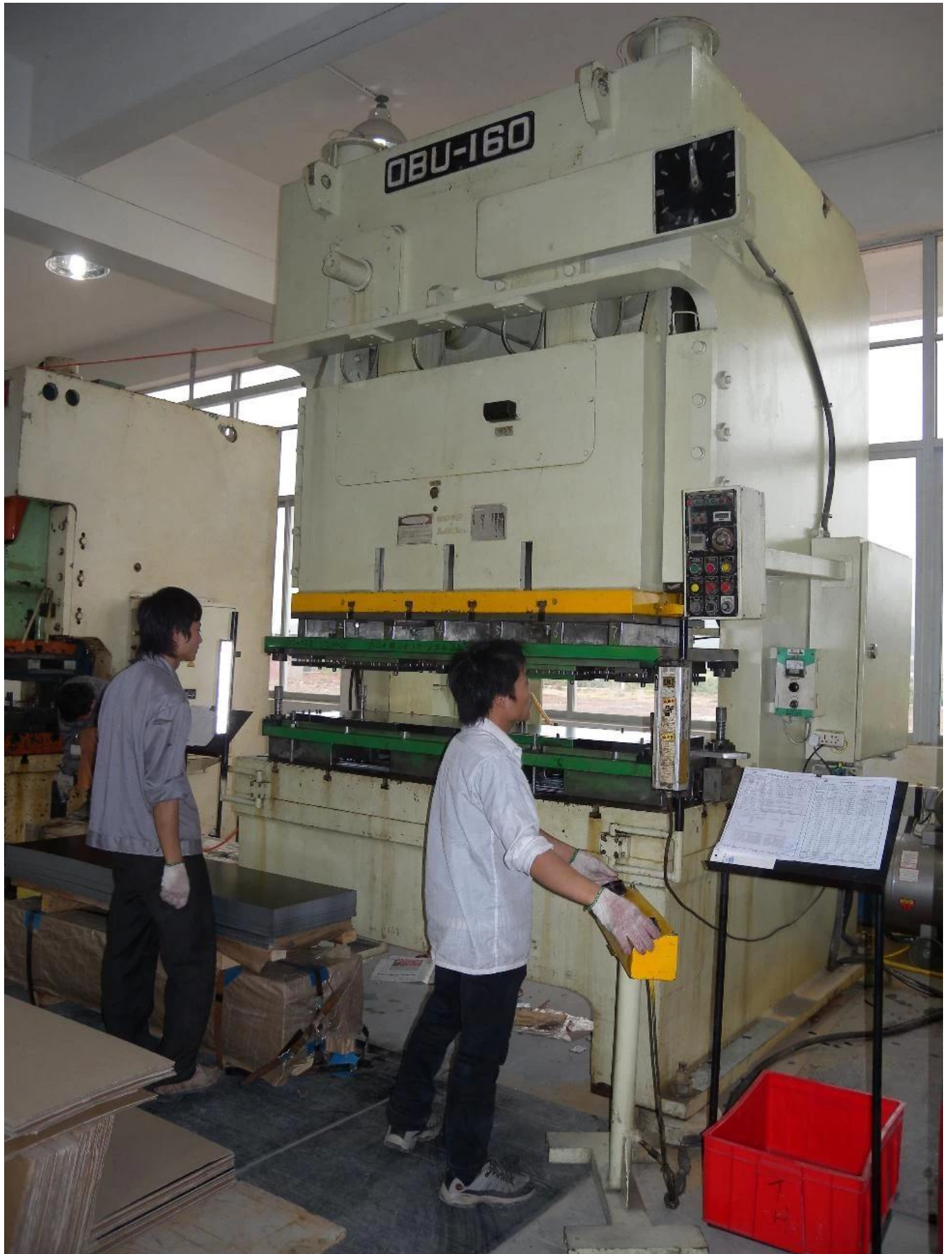
160T 宽台面冲床 模具加工尺寸800*1800mm