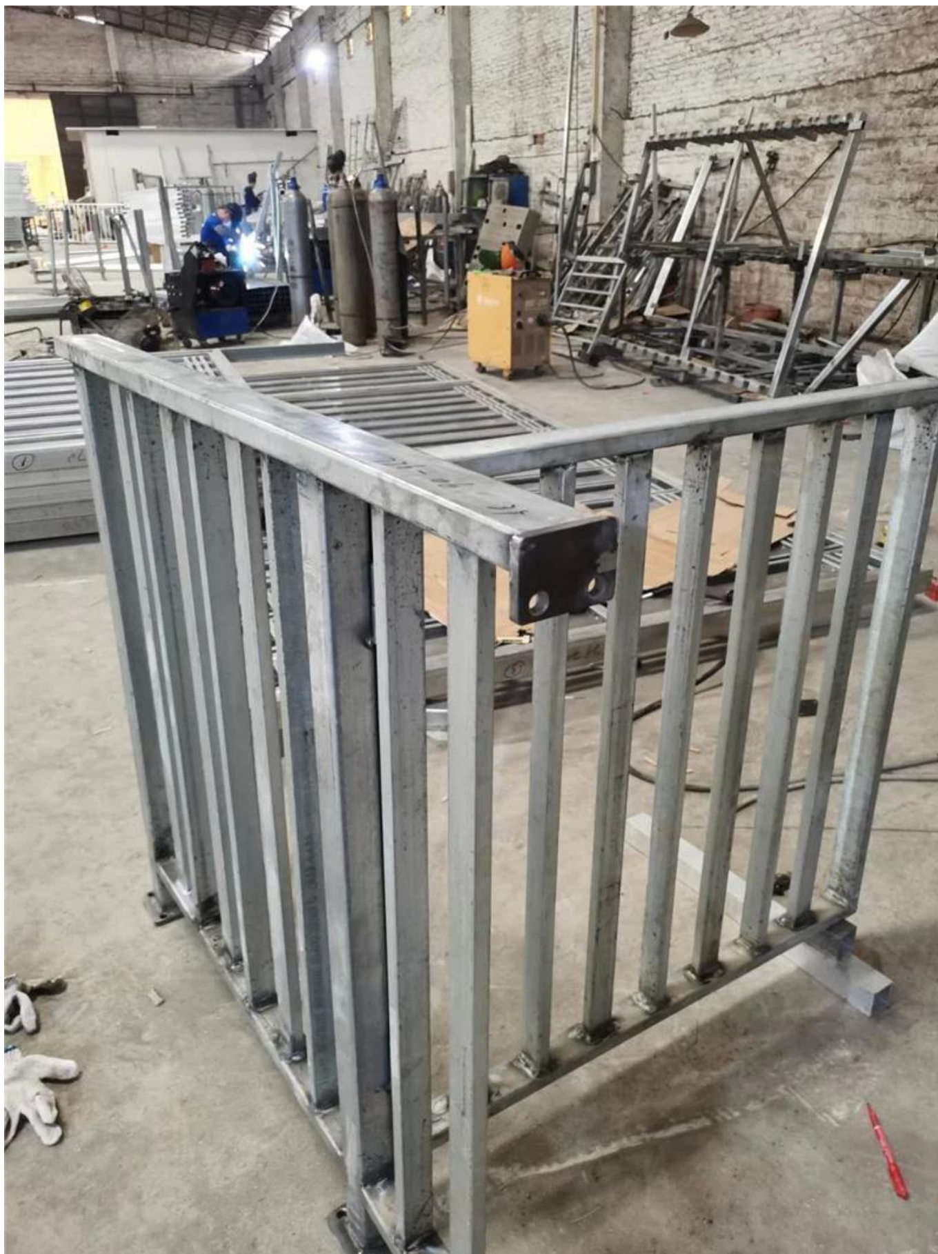
# Photos de projet d'unconceptions de garde-corps de tuyauterie multi-lignes luminum-