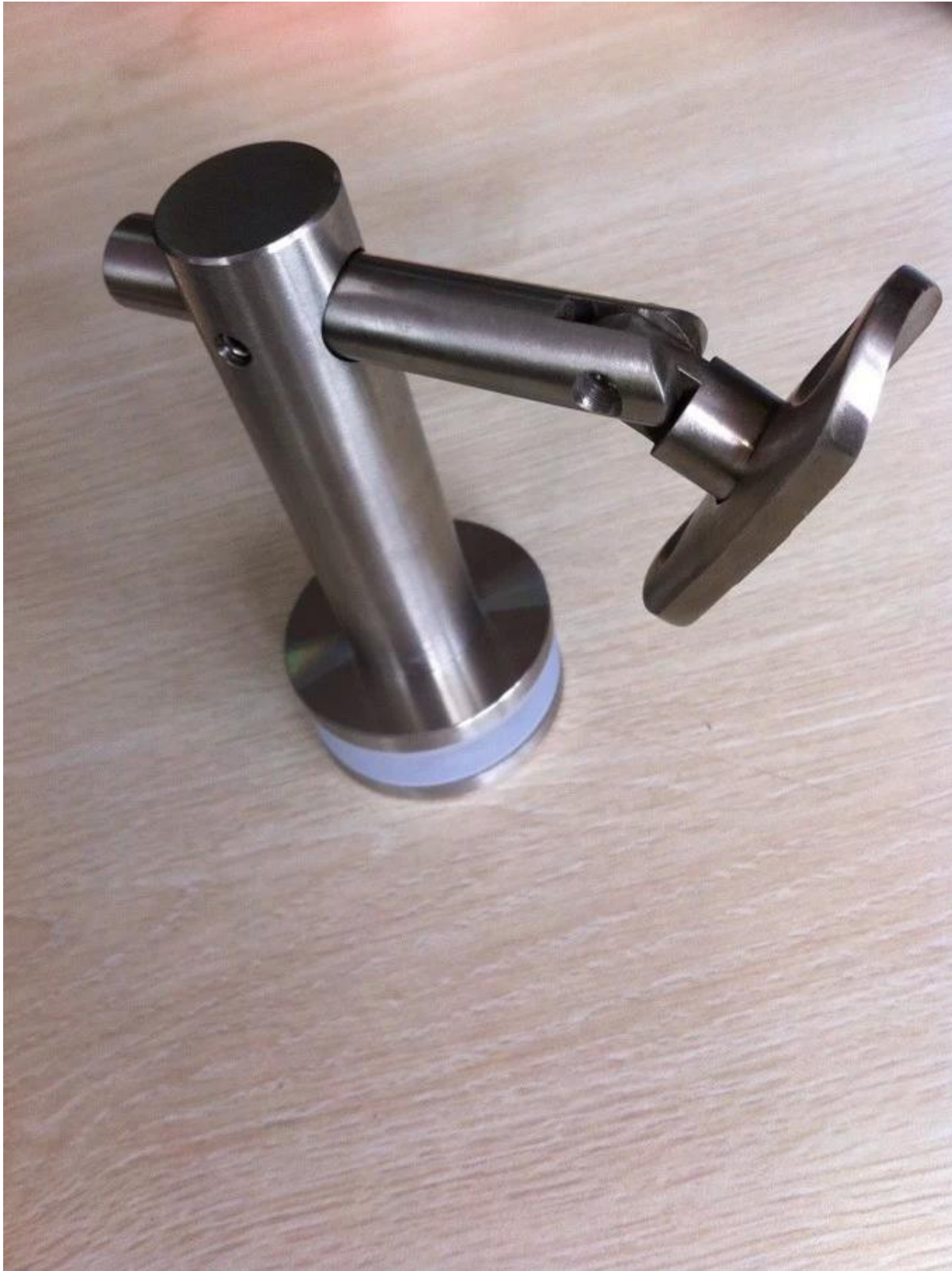
pic de projet