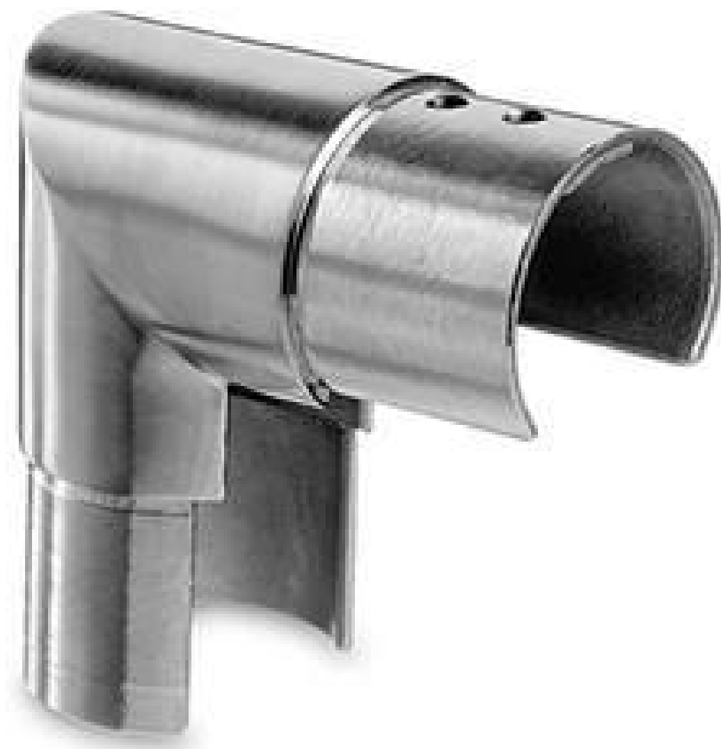
Coude à fentes