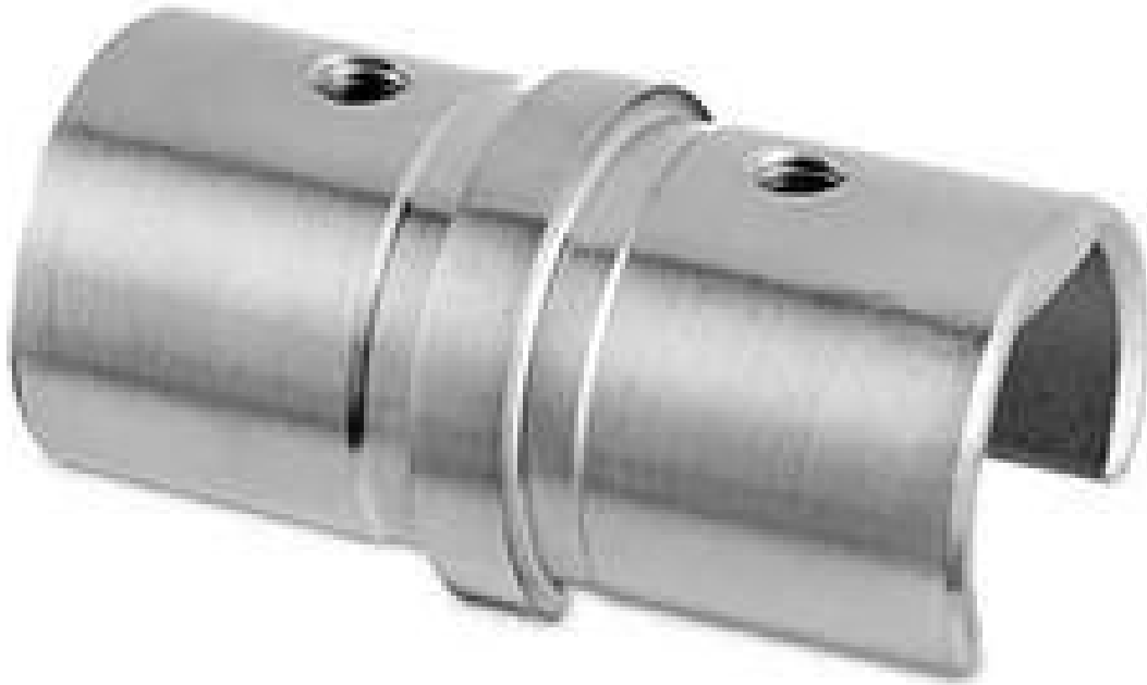
Embout à fente