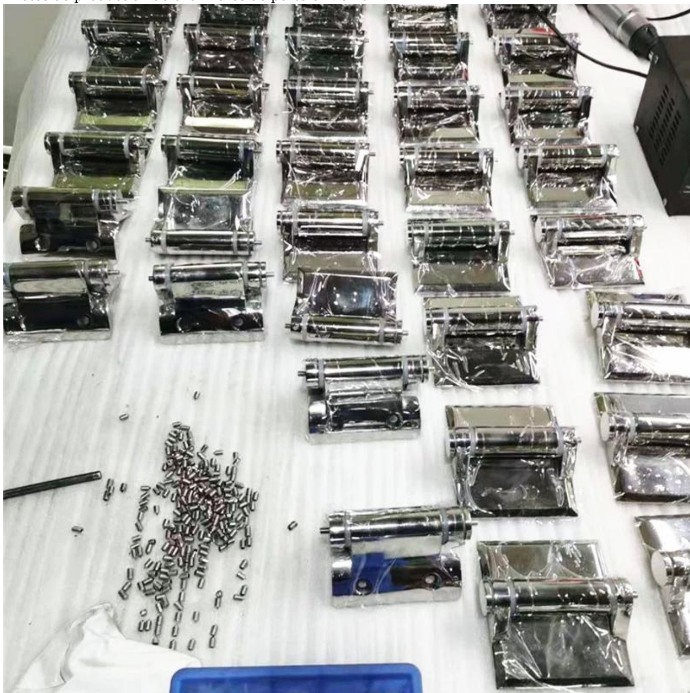
Photos du projet de clôture de piscine-