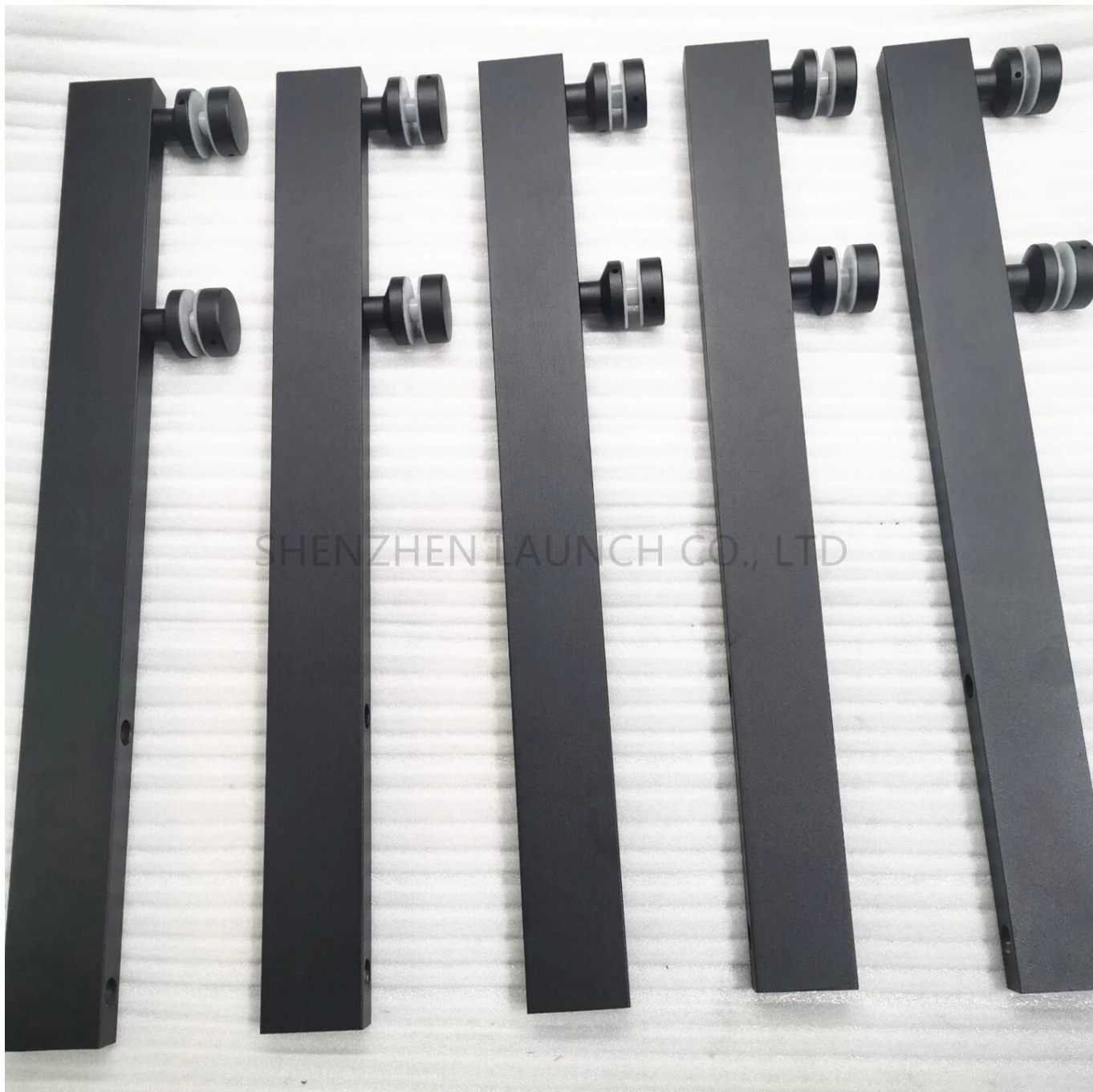
Photo de retour de client après l'installation