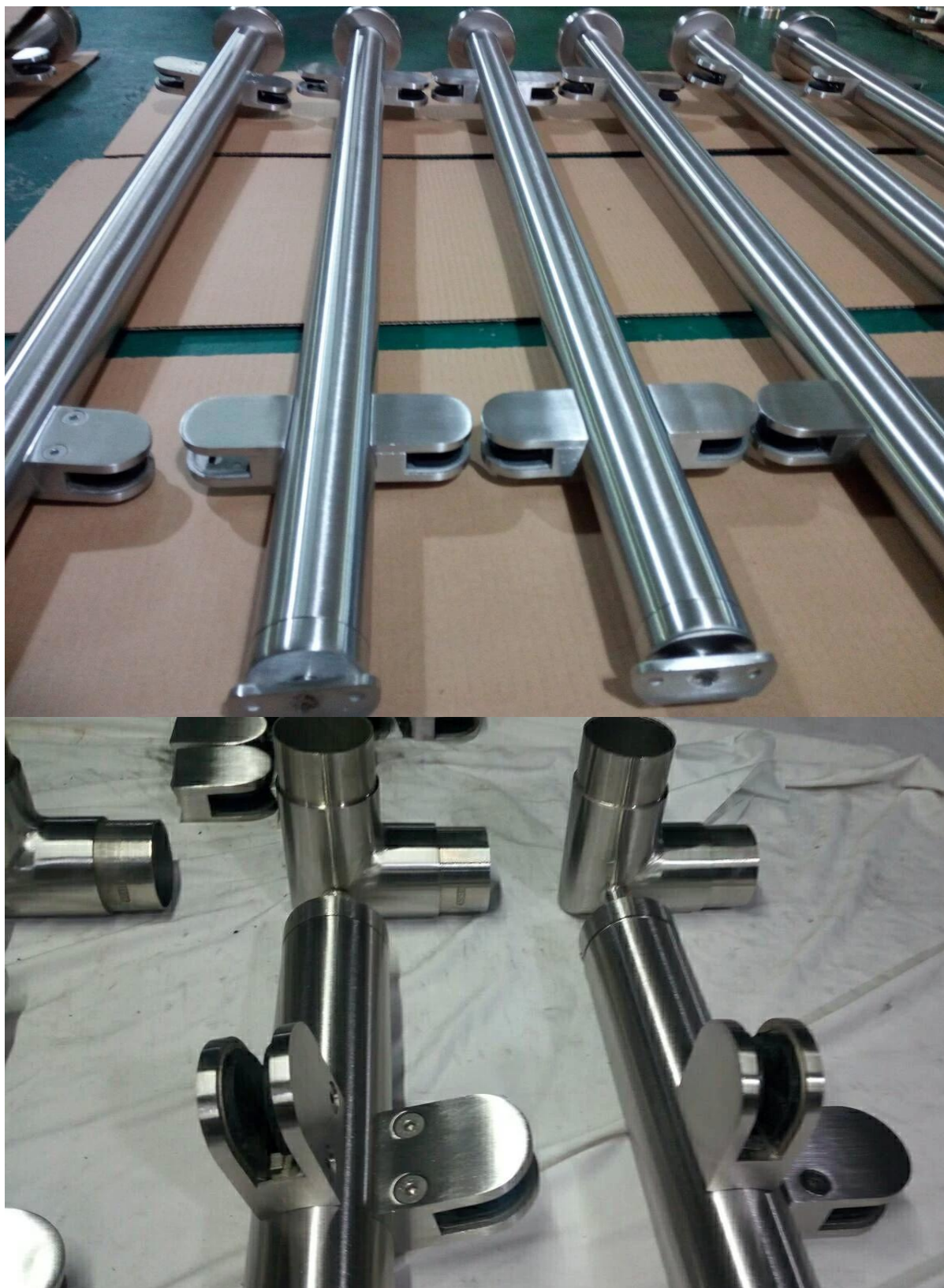
Poteau de main courante en verre avec embout sur le dessus.