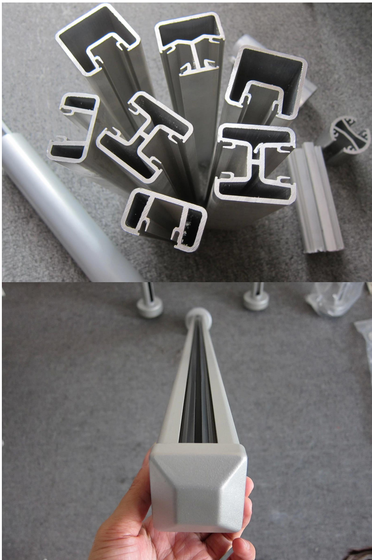
3) Dessin de la main courante en aluminium