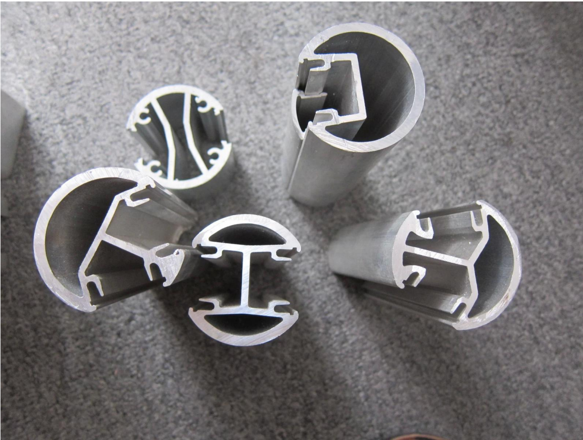
1) Main courante en aluminium ronde