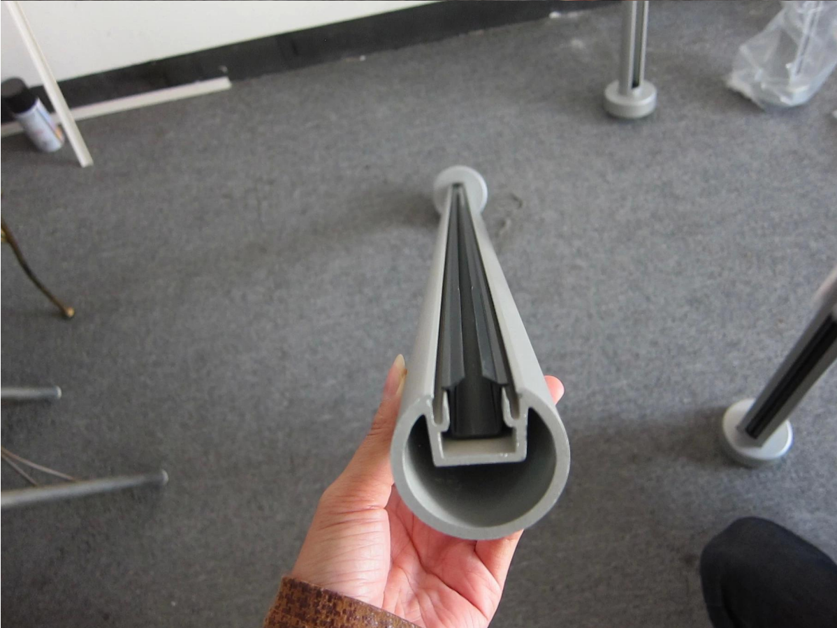
2) Main courante en aluminium