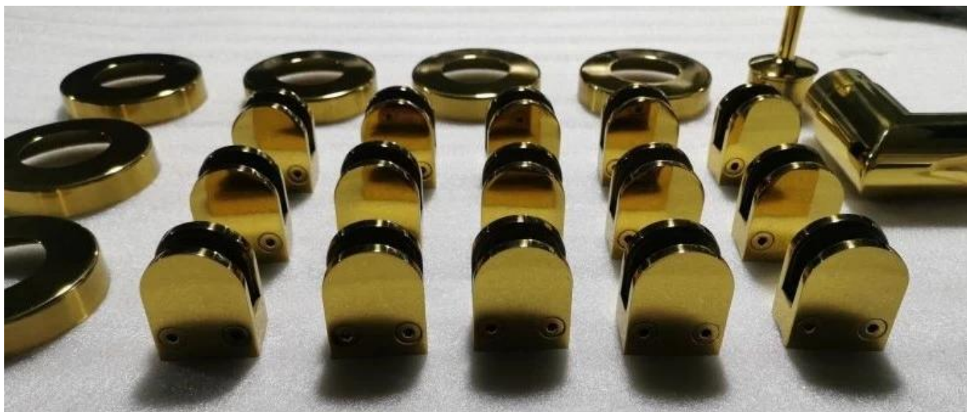
Noir Électroplaqué Finition :