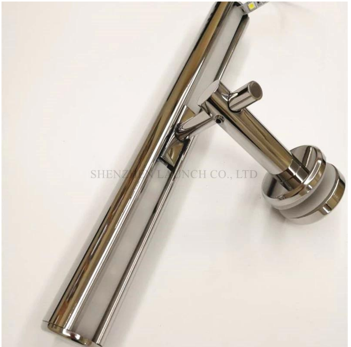
Main courante en acier inoxydable d'éclairage à LED RVB