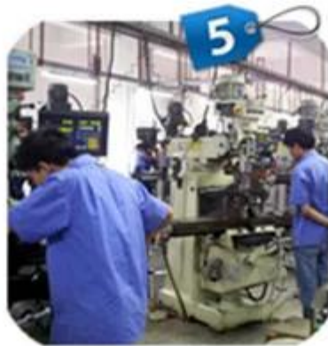
Drilling & Tapping