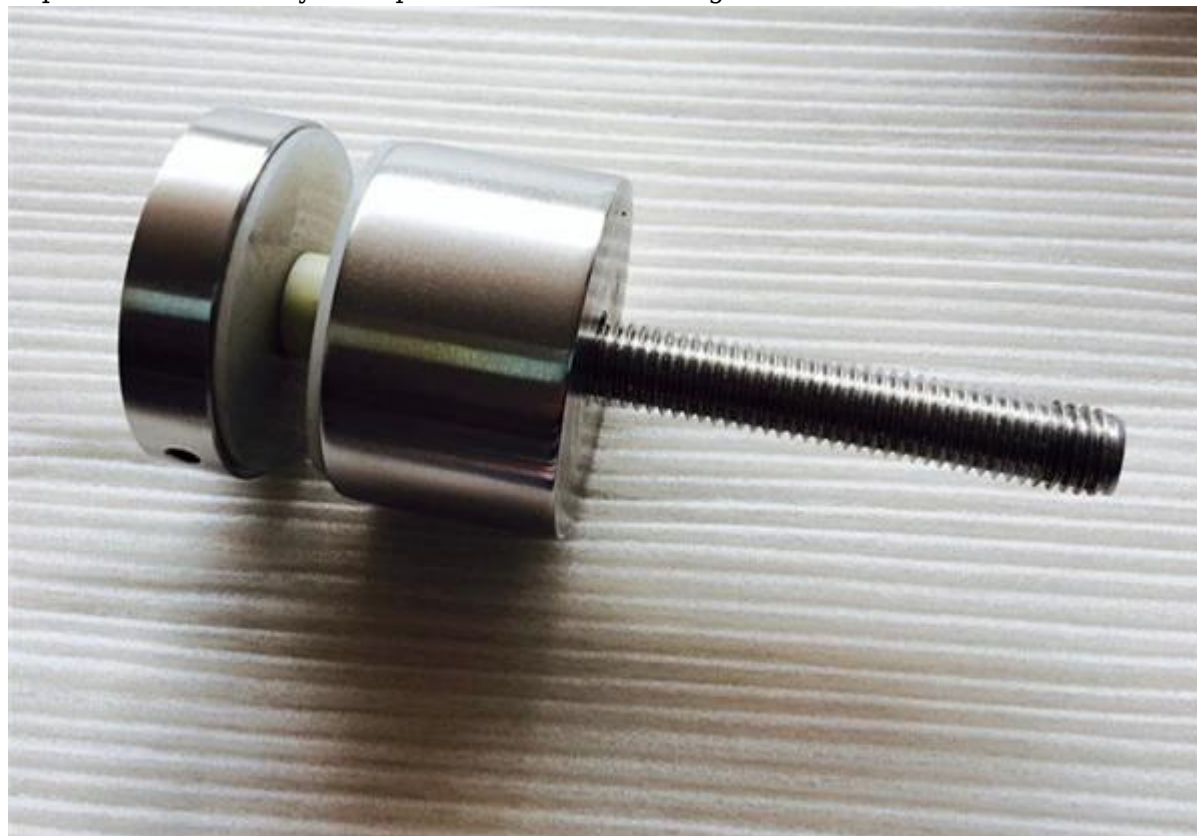
impasse en acier inoxydable pour le pont de montage: