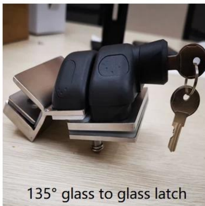
135° glass to glass latch