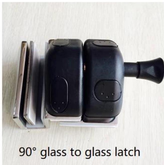
90° glass to glass latch