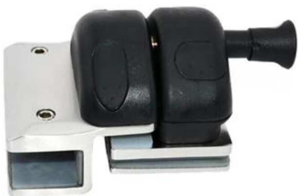
180° glass to glass latch