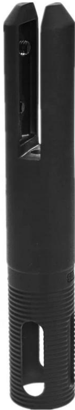
1) Tiges de forage à noyau noir mat pour le dessin technique des balustrades en verre