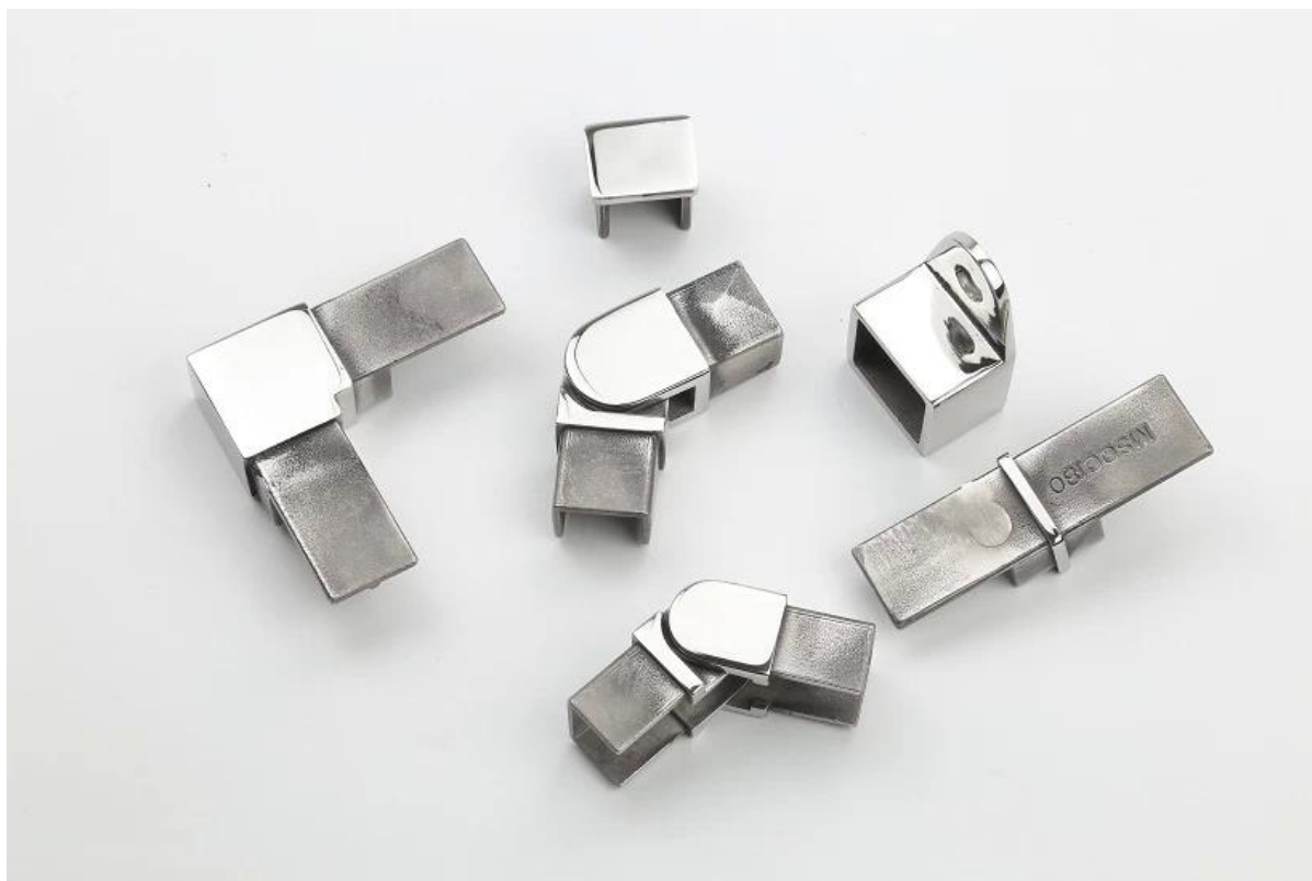
Rail de chapeau de diamètre 25,4 * 1,2 mm -