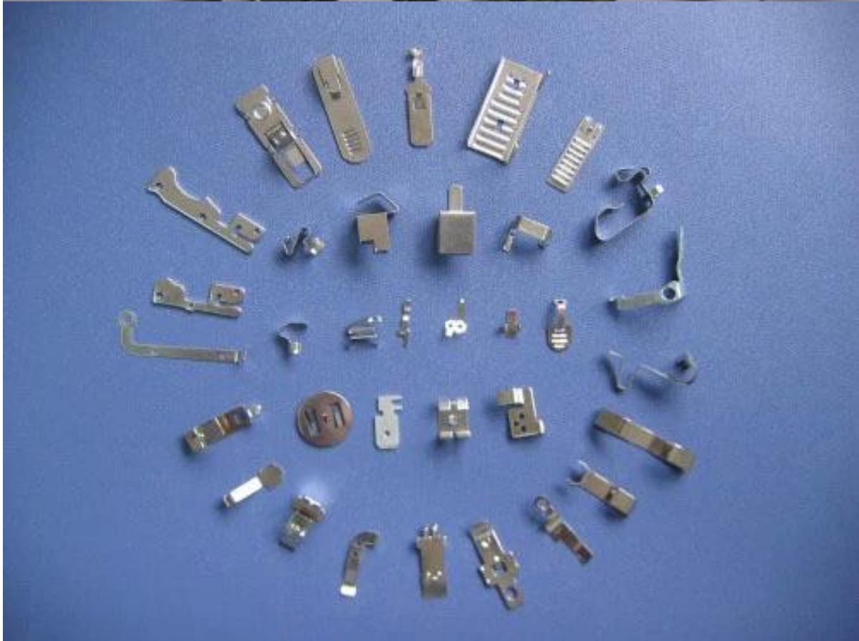
Pièces auto en tôle