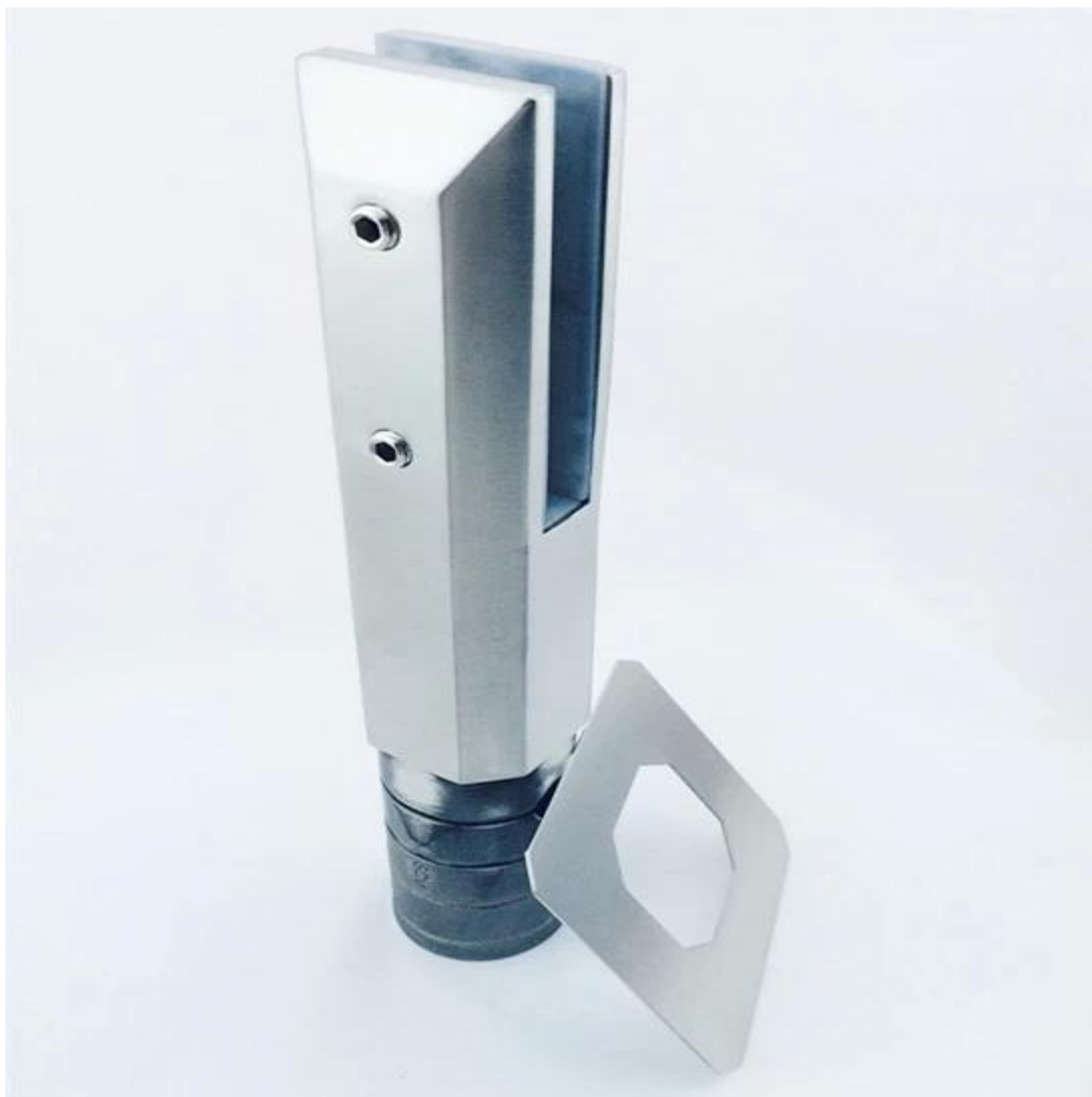
Modèle No .: RBM-2(Ronde robinet de plaque de base)