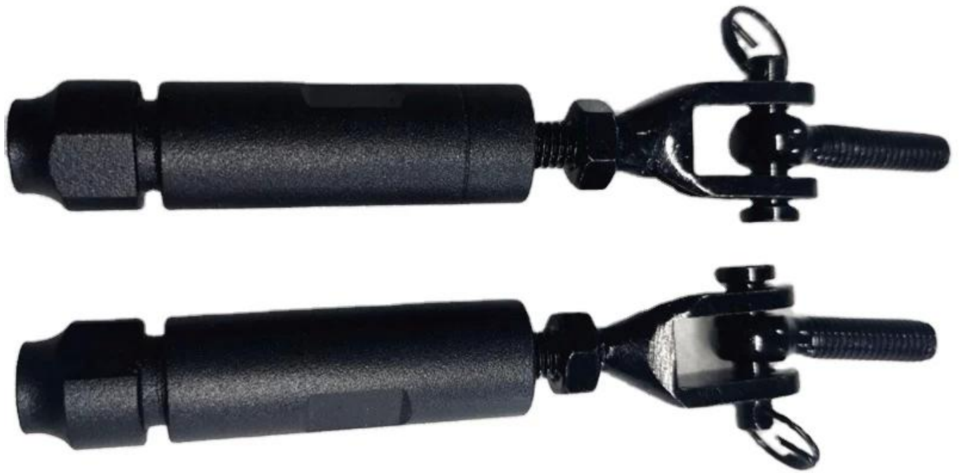
Photos de projet de rail de câble en acier inoxydable