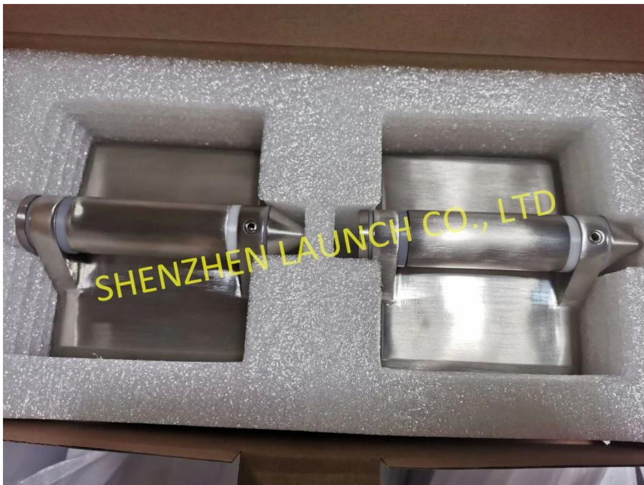
Verre à la charnière de poteau en verre, avec capuchon plat sur les extrémités