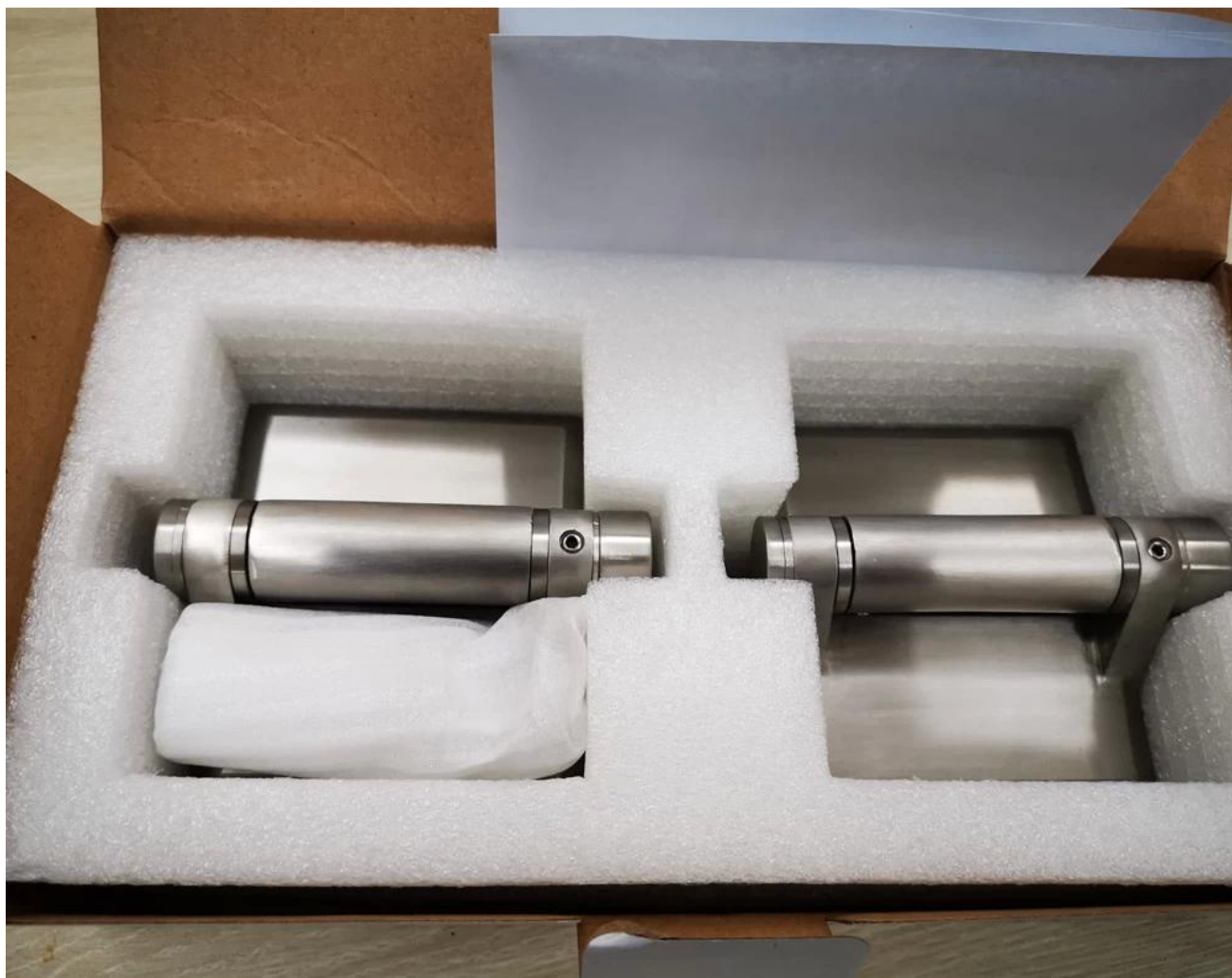
Verre à la charnière de poteau en verre, avec capuchon plat sur les extrémités, en revêtement en poudre noire