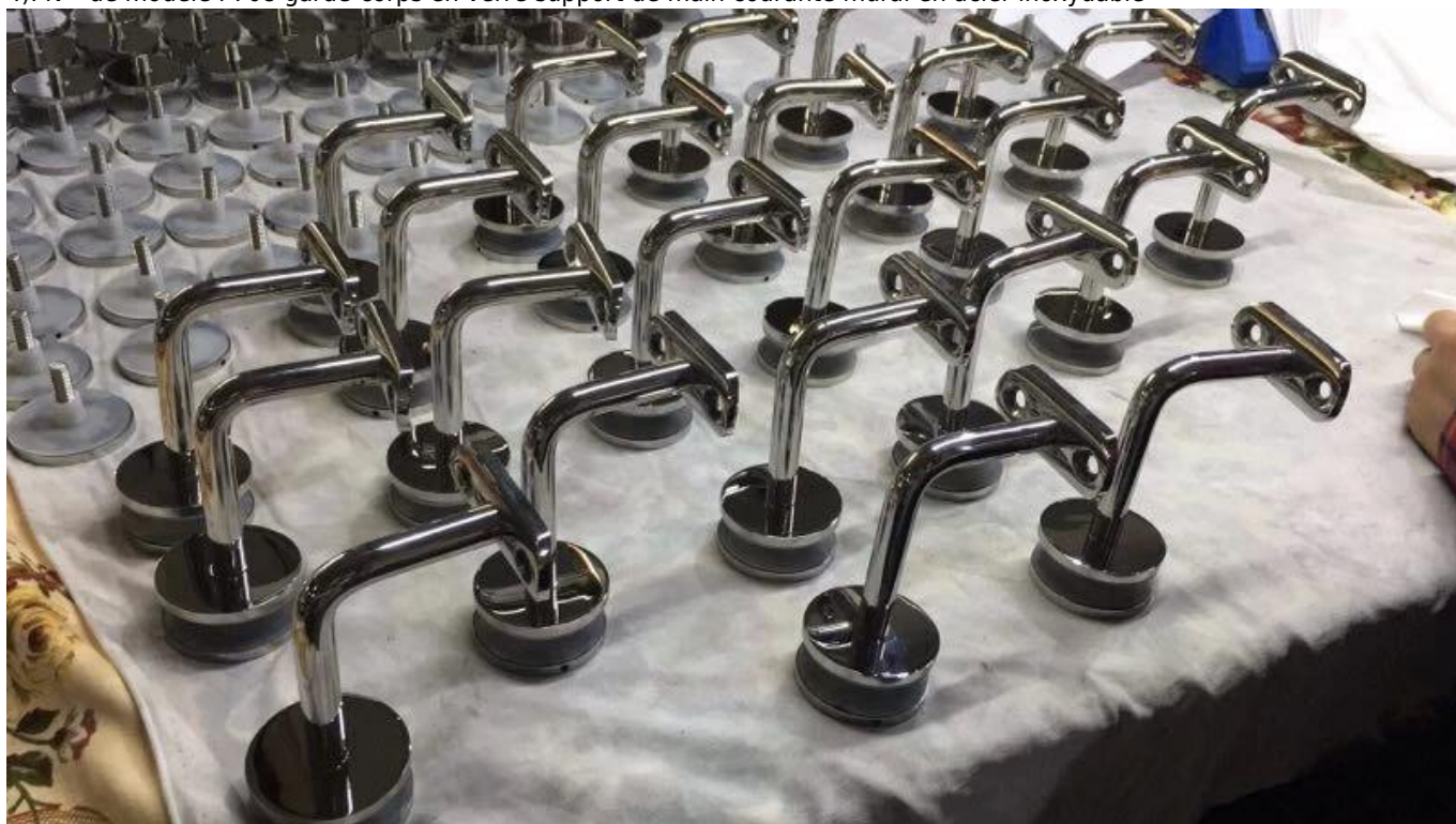
3. garde-corps en verre support de main courante mural en acier inoxydable photo pour votre référence :

Projet de support de main courante réglable :