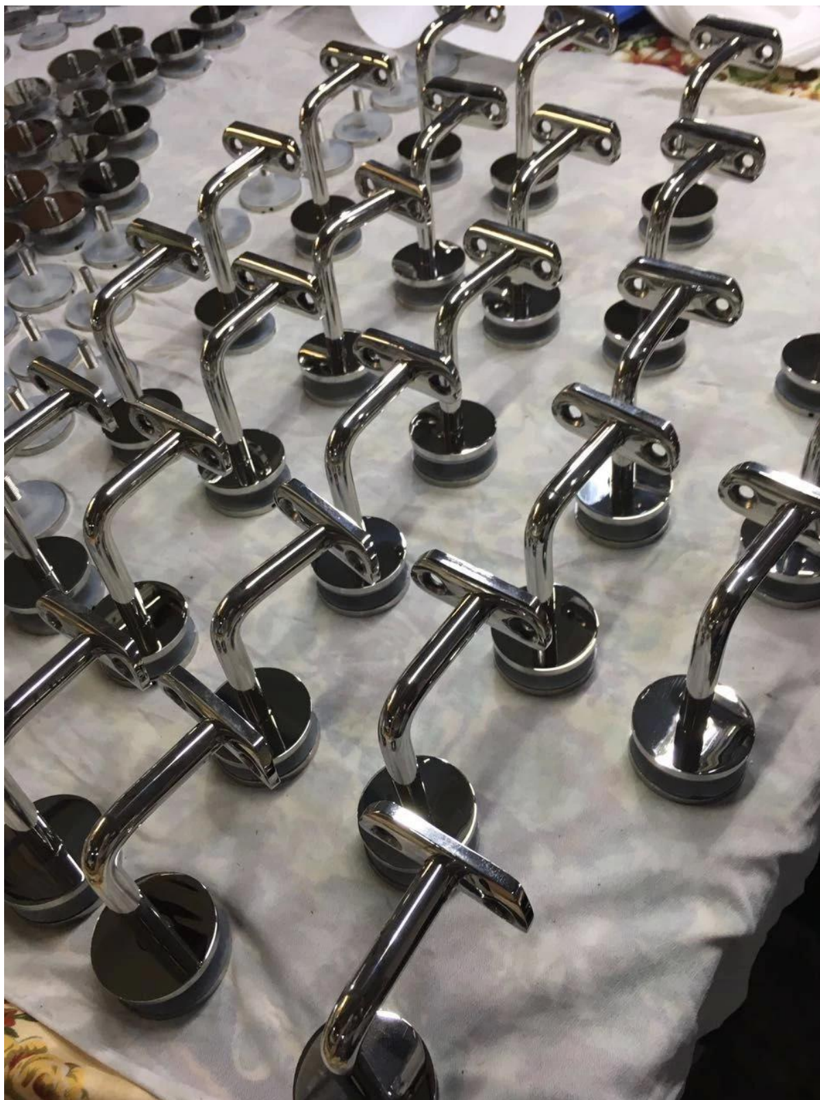
Projet Supports main-courante pour une utilisation en intérieur