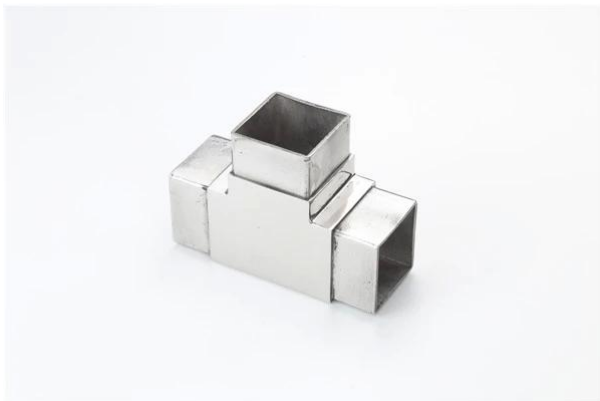
3. Modèle n ° S403 en acier inoxydable connecteur 3 voies à 90 degrés