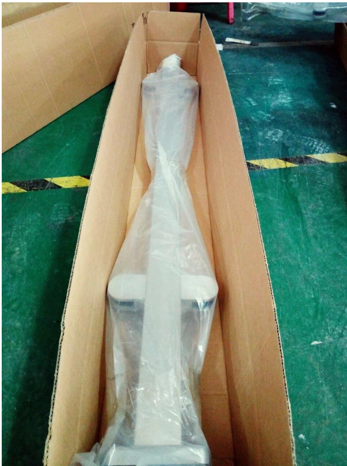
4. projets. photos d'escalier plateforme idée verre carré Balustrades inox avec main courante supérieure