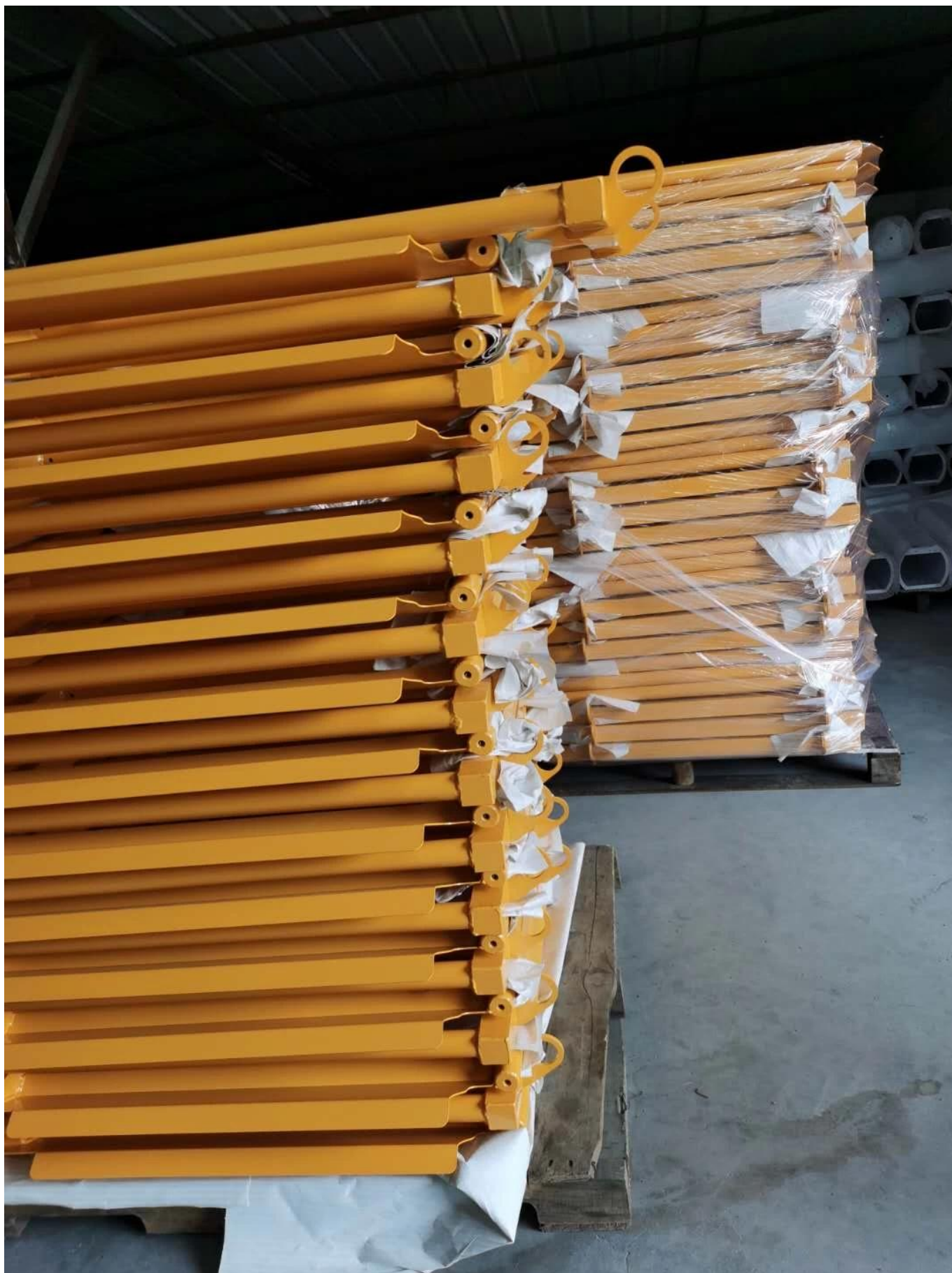
# Mains courantes de sécurité en aluminium appliquées dans les gares -