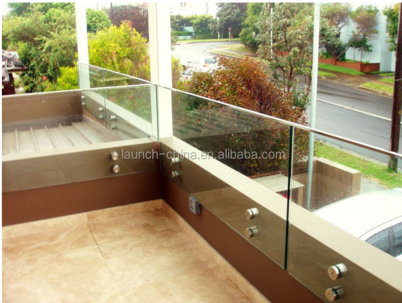
2. Escalier en acier inoxydable conception de garde-corps en verre de bras de fer