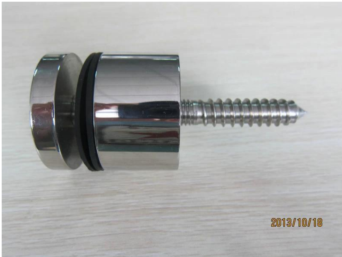
pic de projet