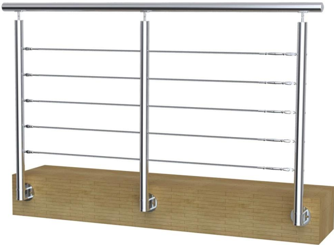
3. Smontage côté acier tainless poste de garde-corps de balcon en plein air :