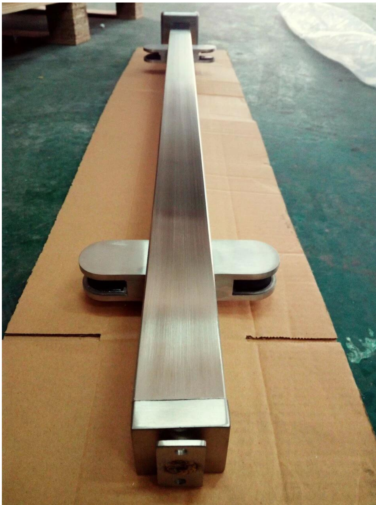
Brossé fini 2 voies 90 ° post