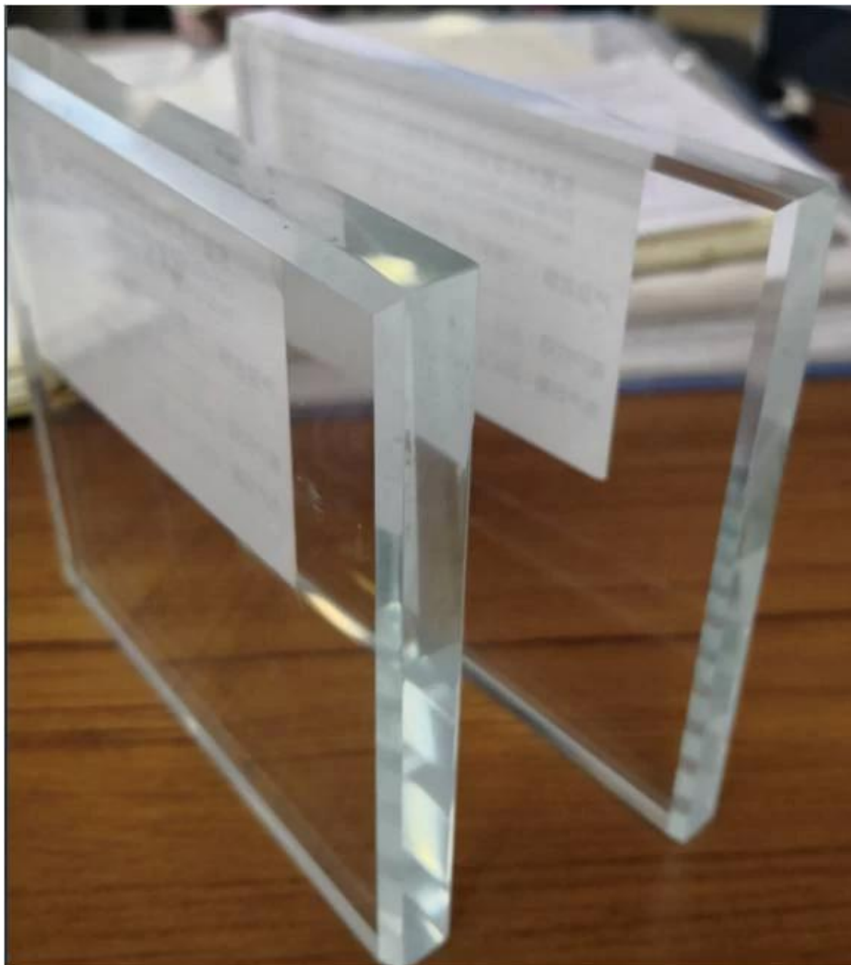
Trou de verre coupé sur des panneaux de verre trempé ultra-clair.

Vous trouverez ci-dessous d'autres photos de verre trempé ultra-clair de 15 mm d'épaisseur destiné à un projet de garde-corps en verre dans les bâtiments de l'aéroport de Honolulu -