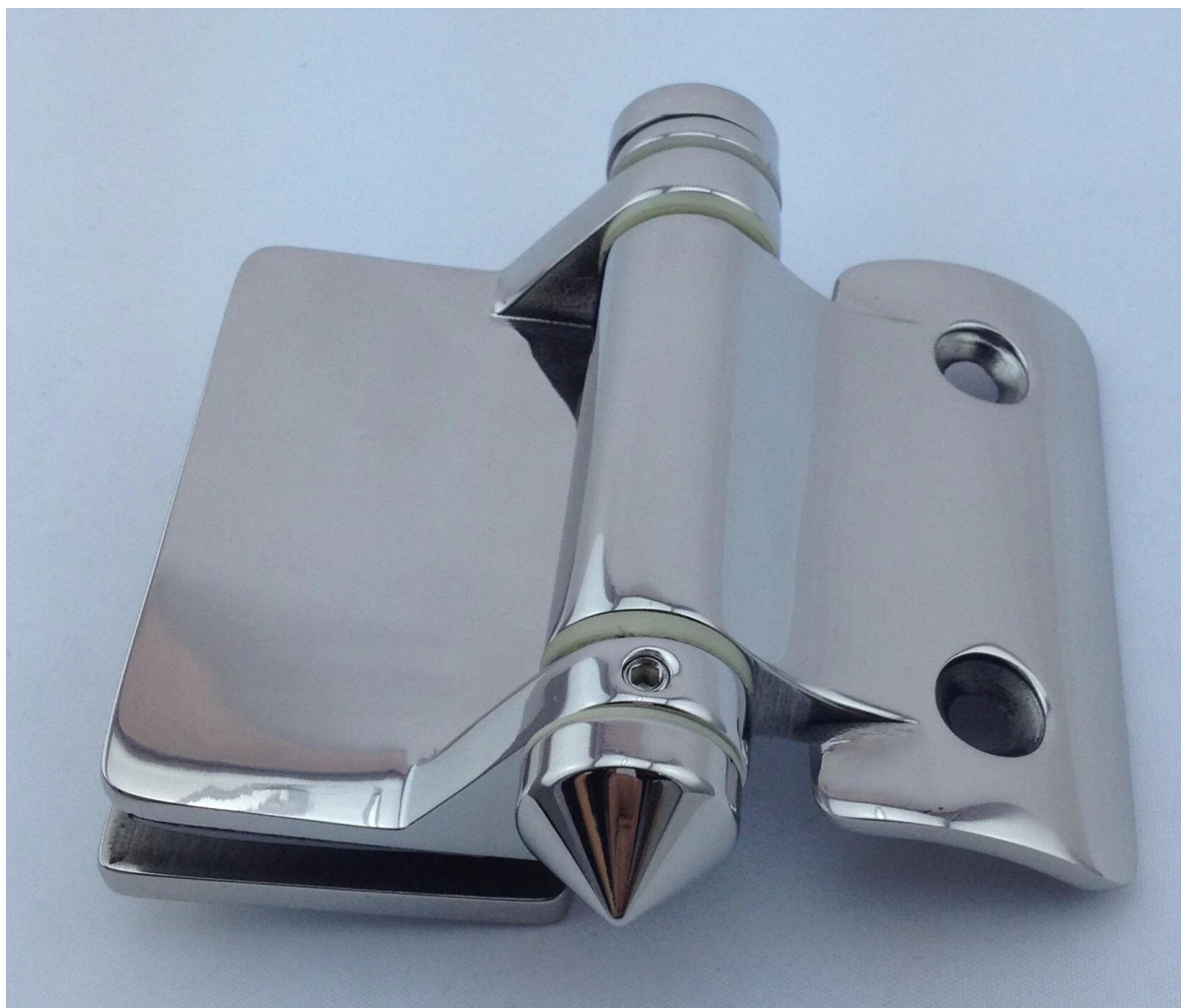
verre à charnière de paroi