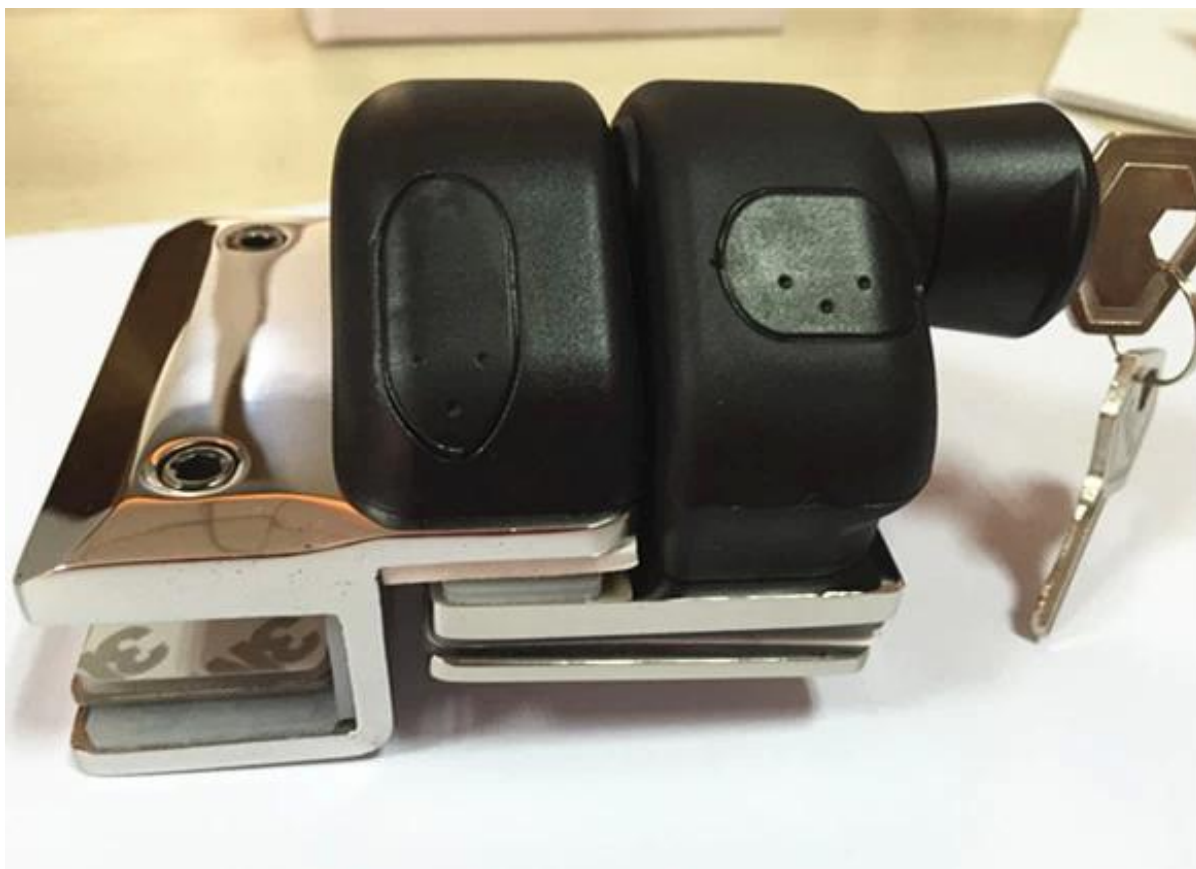
• Photos d'installation d'une clôture en verre sans cadre,