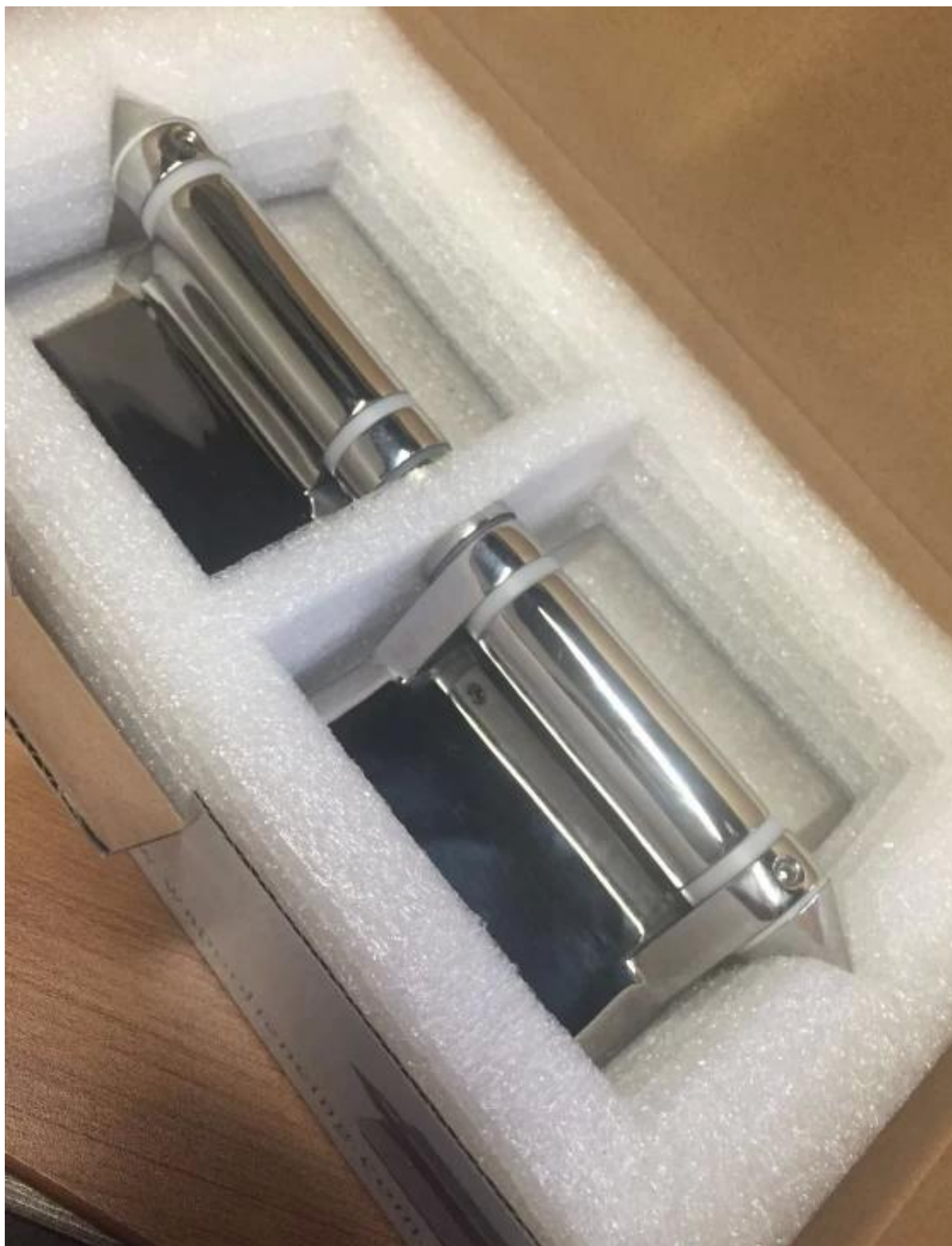
La gauche est le modèle n ° G-G2, et la droite est G-G: