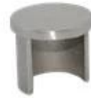
Round top rail