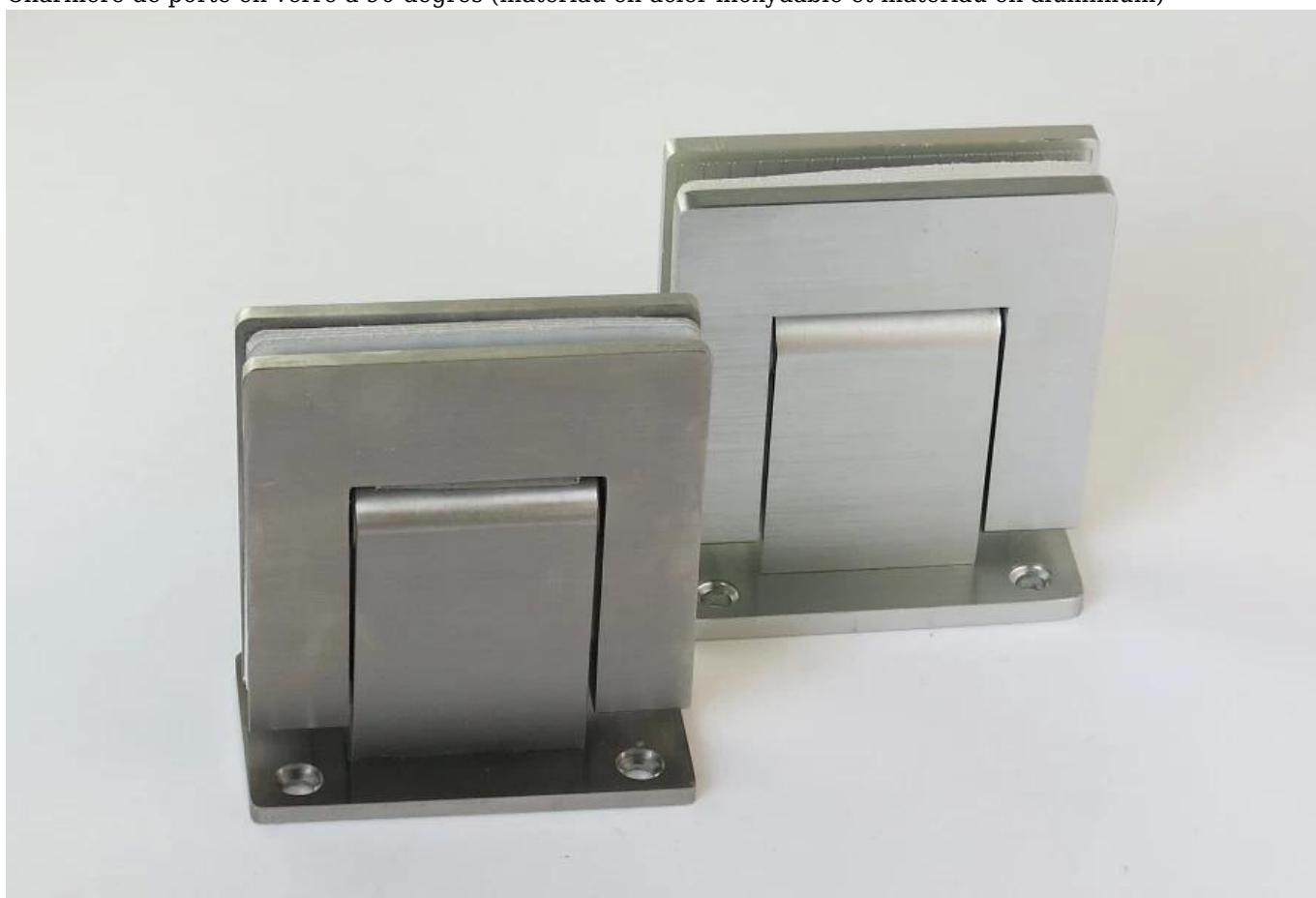
Comment installer la charnière de porte en verre?