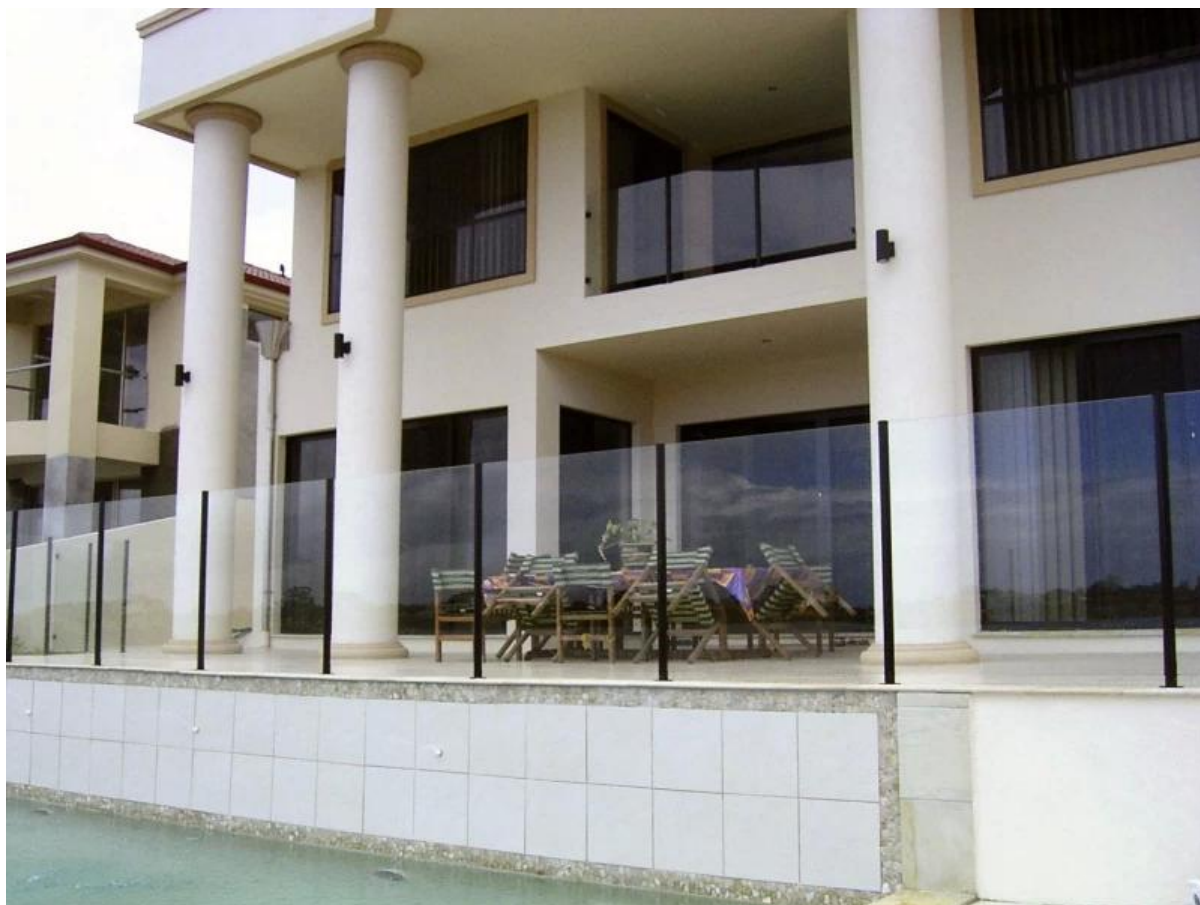
Revêtement en poudre gris