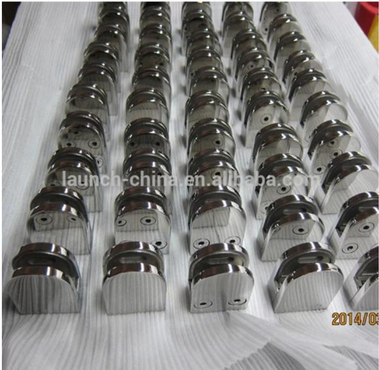
pic de projet