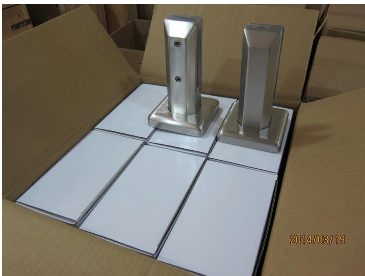
pont d'ofsquare projet photo monter verre robinet inox 316 autour