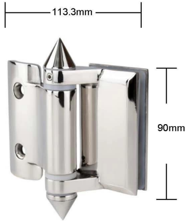
Part # G-R