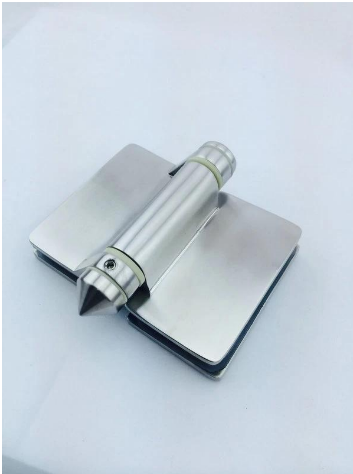
G-G2 charnière de porte en verre, poli miroir, avec le bord biseauté; Cliquez sur l'image pour plus d'informations: